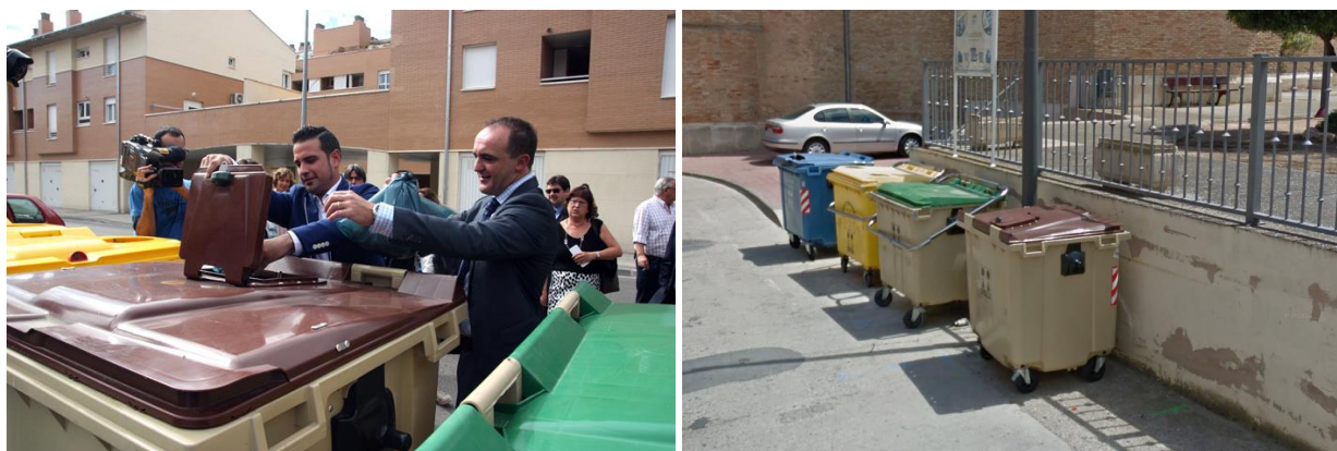
Figura 1. Presentació dels nous contenidors amb pany per a la recollida de la matèria orgànica a Peralta (esquerra) i contenidor per a la recollida de la matèria orgànica a Milagro (dreta). Font: Mancomunitat de la Ribera alta de Navarra, 2017.

Es tracta d'un sistema de participació voluntària que funciona mitjançant l'ús d'una clau que s'entrega a totes aquelles persones que s'inscriuen al programa. La inscripció s'ha de realitzar a les oficines d'algun dels ajuntaments de la Mancomunitat o a les pròpies instal·lacions de la Mancomunitat, firmant un compromís previ de compliment dels objectius del programa: només dipositar matèria orgànica i tenir cura de la clau, la qual és personal i intransferible.