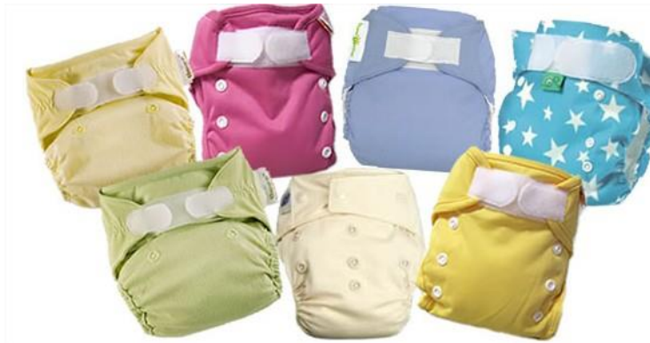
Figura 1. Exemple de bolquers reutilitzables.

excrements dels nadons. Per altra banda, alguns bolquers utilitzen una tela o forro entre la pell i el bolquer, per tal que sigui més fàcil recollir els excrements. No obstant això, en aquest cas tampoc es generen residus perquè poden ser rentats o d'un sol ús però degradables (Rezerø).