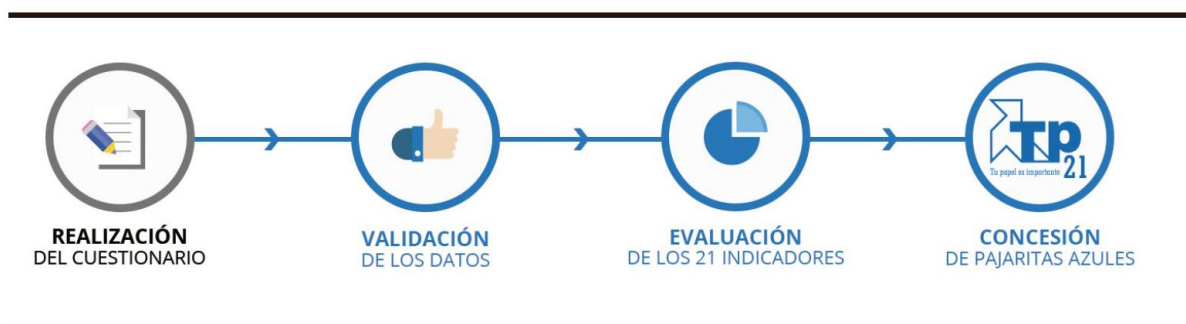
Figura 1. Programa Pajaritas Azules. ASPAPEL. 2018.

L'avaluació es realitza en base a 21 indicadors que s'agrupen en cinc blocs: recollida del contenidor blau, recollides complementàries, informació i conscienciació ciutadana, regulació i planificació i resultats i traçabilitat fins al reciclatge final. Cada un dels indicadors es valora segons uns barems establerts, essent la puntuació màxima que es pot assolir de 100 punts. En aquest sentit, aquells municipis que cada any destaquen entre els participats en el programa per assolir alts nivells d'excel·lència en la gestió de la recollida selectiva de paper-cartró se'ls hi atorguen pajaritas azules .