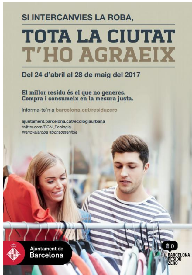
Figura 2. Campanya Renova la teva roba. Ajuntament de Barcelona, 2017.

Els punts d'intercanvi de roba no s'encarreguen de rentar o arreglar la roba, per tant, és important que la roba estigui neta, en bon estat de conservació, sense forats, descosits ni taques. Addicionalment, cal destacar que no s'accepten sabates, roba interior ni de la llar, essent 10 el nombre màxim de peces a intercanviar per persona.