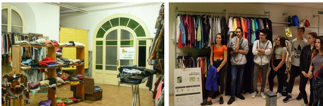
Figura 2. Botigues d'intercanvi de roba.