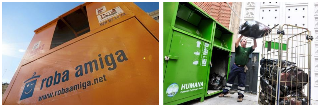
Figura 1. Contenidors de Roba Amiga i Humana.

tèxtils. En aquest sentit, a Catalunya existeixen múltiples projectes que, a més, inclouen una vessant social, com per exemple Roba Amiga (cooperativa que es va posar en marxa a partir de la iniciativa de l'Obra Social la Caixa Catalunya, AIRES i Càrites, essent un projecte de reinserció social), Humana (organització que treballa en projectes de cooperació a l'Àfrica i el Quart Món, on part del finançament prové de la revenda de roba de segona mà), entre altres.