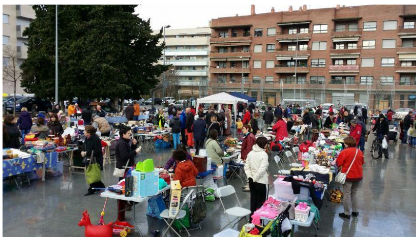
Figura 1. Mercat d'intercanvi de Pla de Palau. Associació de veïns de Pla de Palau, 2014.

Tots els ciutadans poden participar al mercat d'intercanvi portant aquells objectes vells o nous d'utilitat que ja no els són necessaris i dels quals es volen despendre: llibres, electrodomèstics, roba, mobles, eines, objectes de la llar, jocs, material informàtic, etc. L'objectiu d'aquests mercats és fer pensar i reflexionar a la ciutadania sobre el consum responsable en un moment en què la societat està immersa en la cultura del "comprar, usar i llençar", al mateix temps que es redueix la generació de residus municipals.